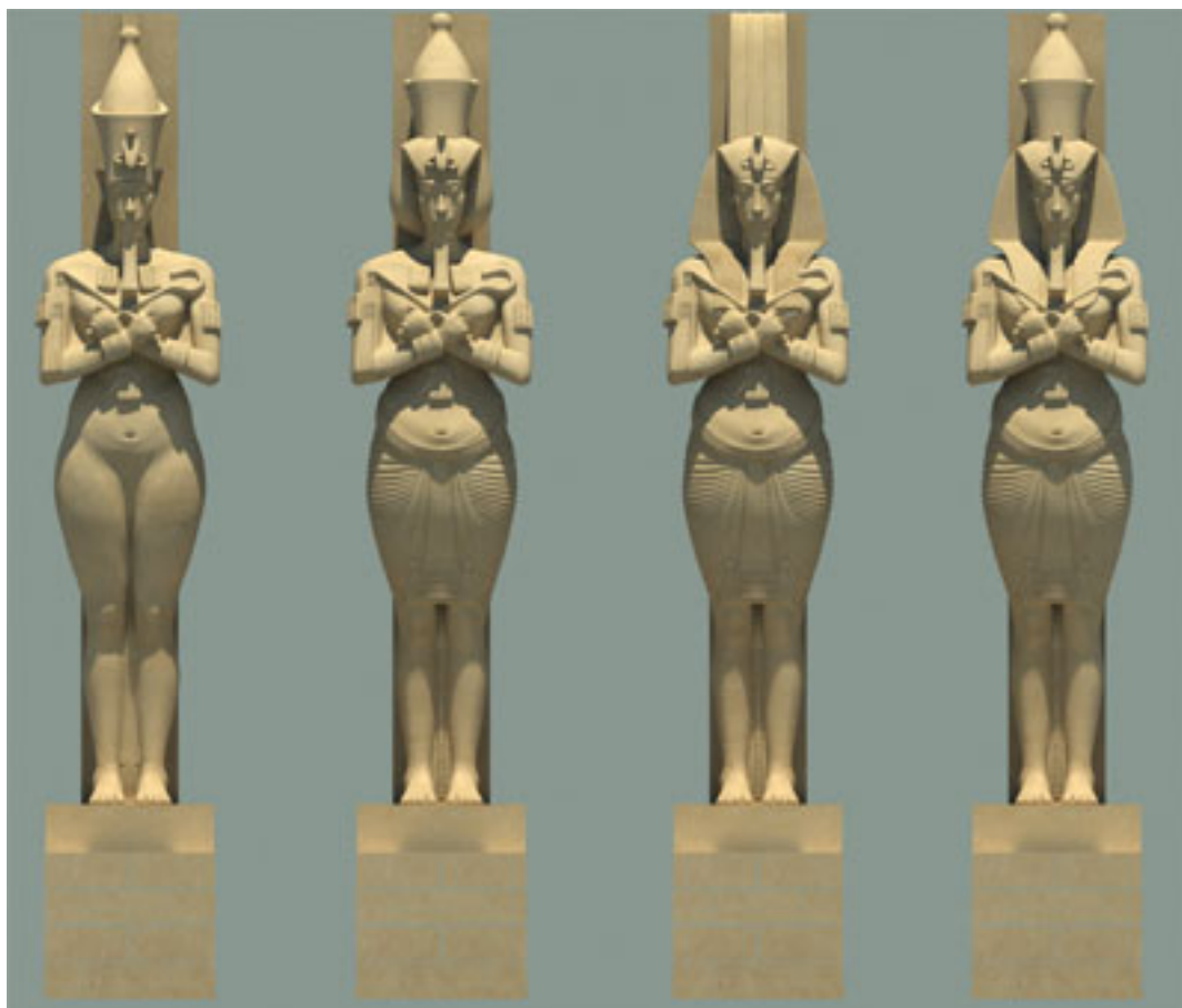
Fig. 3 : Reconstitution 3D de plusieurs des colosses d'Amenhotep IV – Akhenaton et Nefertiti à Karnak-est © Archéovision.

Les colosses de Karnak-est, dont aucun exemplaire intact de la tête aux pieds n'a subsisté, ont été réexaminés à cette occasion, d'autant plus que leur datation de l'époque d'Amenhotep IV – Akhenaton avait récemment été mise en question 9 . L'examen minutieux des moindres fragments (D. Laboury) et l'utilisation régulière de l'infographie ont permis de reconstituer dans leur variété un grand nombre des statues, affinant leurs dimensions, leurs proportions, leur polychromie et leur épigraphie de manière substantielle, si bien que la part des incertitudes est désormais moins importante que celle des certitudes.