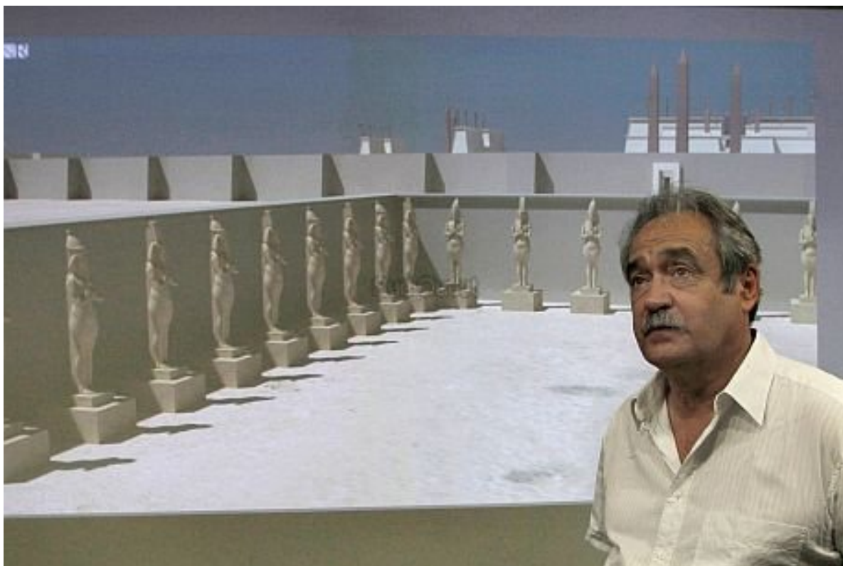
Fig. 1 : Reconstitution infographique en temps réel de la cour d'Amenhotep IV – Akhenaton lors de la séance de travail du 15 septembre 2009 © Archéovision.

les efforts des participants sur la grande structure découverte à l'est de Karnak par Henri Chevrier en 1925 2 qui avait ensuite été fouillée par D. Redford 3 . L'hypothèse d'une enceinte carrée proposée par R. Vergnieux 4 avait été confirmée par la fouille à laquelle avait participé E.C. Brock en 2004 5 et avait permis d'assurer que la structure principale dont les vestiges avaient été mis au jour était une grande cour carrée de 210 m (400 coudées) de côté comprise dans une enceinte épaisse de 2,10 m (4 coudées) élevée en talatates et bordée intérieurement de colosses monumentaux du roi et de la reine.